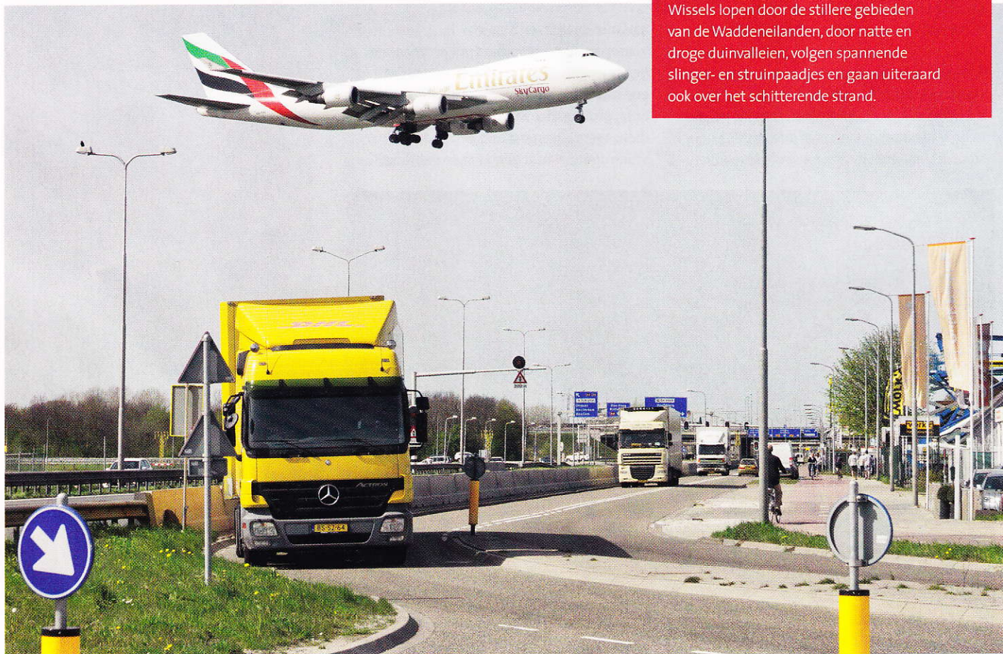
Zelfs de lelijkste Groene Wissel (vanaf Schiphol) is populair en inmiddels al door bijna achthonderd wandelaars gelopen. De reacties zijn enthousiast, tot verbazing van de ontwerper.

Voor wie een Waddeneiland bezoekt: Wadden Wissels lopen door de stillere gebieden van de Waddeneilanden, door natte en droge duinvalleien, volgen spannende slinger- en struipaadjes en gaan uiteraard ook over het schitterende strand.